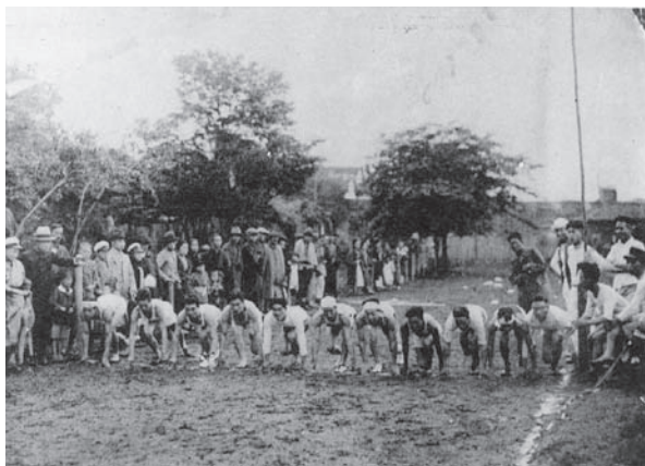
大正12年 本学初の大運動会（府中町運動場）